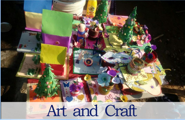
Art and Craft